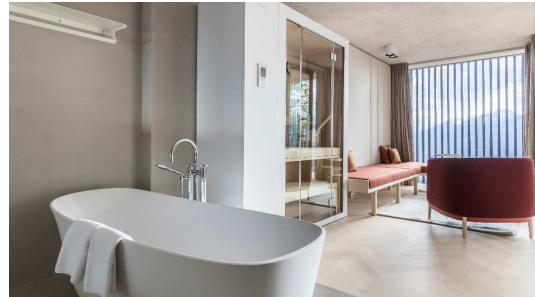
Bild 2: Die raumsparende Sauna S1 – Komfort auf kleinstem Raum gibt's nun auch „manuell“.

Bild 1: Das Miramonti Boutique Hotel mit eingebauter Sauna S1 lässt das Hotelzimmer in eine private Spa-Suite verwandeln.