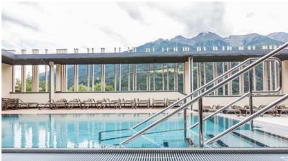
Bild 3: Eintauchen und abschalten. Das Panorama der Mieminger-Kette beeindruckt, besonders die geschichtsträchtige Hohe Munde.