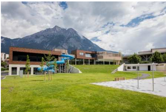
Bild 7: Baden und entspannen in unmittelbarer Naturnähe. Die spektakuläre Bergwelt der Kalkalpen wacht über das Telfer Bad.