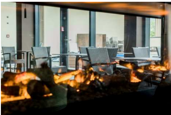
Bild 6: Entspannen auch nach dem Saunagang. Im Café können die Batterien im Anschluss bei alkoholfreiem Weißbier und Co wieder aufgeladen werden.