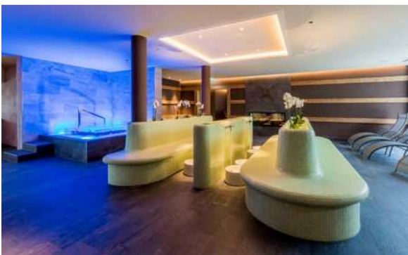
Bild 2: Einfach mal die Seele baumeln lassen. Das beleuchtete, gläserne Tauchbecken verspricht die wohltuende Abkühlung nach dem Saunagang.